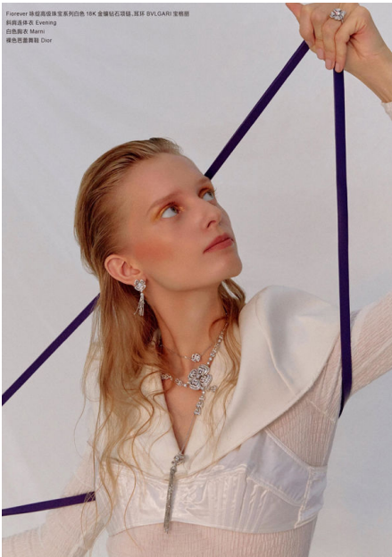
Forever 永恒高级珠宝系列白色 18K 金镶钻石项链、戒指 DVLGAR1 宝格丽 利图露球衣 Evening 巴黎露球鞋 Dior 绿色芭蕾舞鞋 Dior