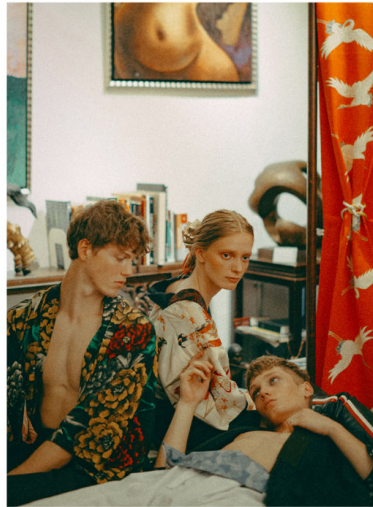
Vintage Japanese Admire worn by all three models, SEN TOSHIOKI SHIMAZU .

INTERNATIONAL MODEL MANAGEMENT 36, rue Jourdan | 1060 Bruxelles | Belgium +32 2 537 26 86 | booking@immbruxelles.com | www.immbruxelles.com