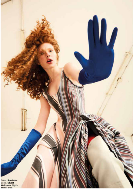
Dress: Sportmax. Boots: Stuart Weitzman. Tights: Stylsit Own.